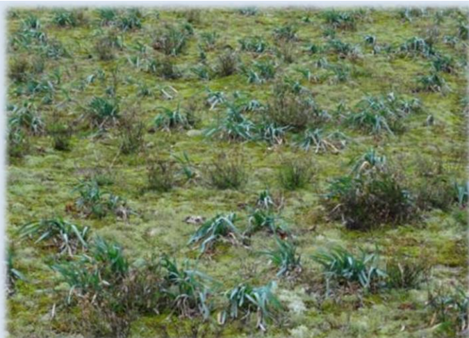
Secteur de densité moyenne à forte.