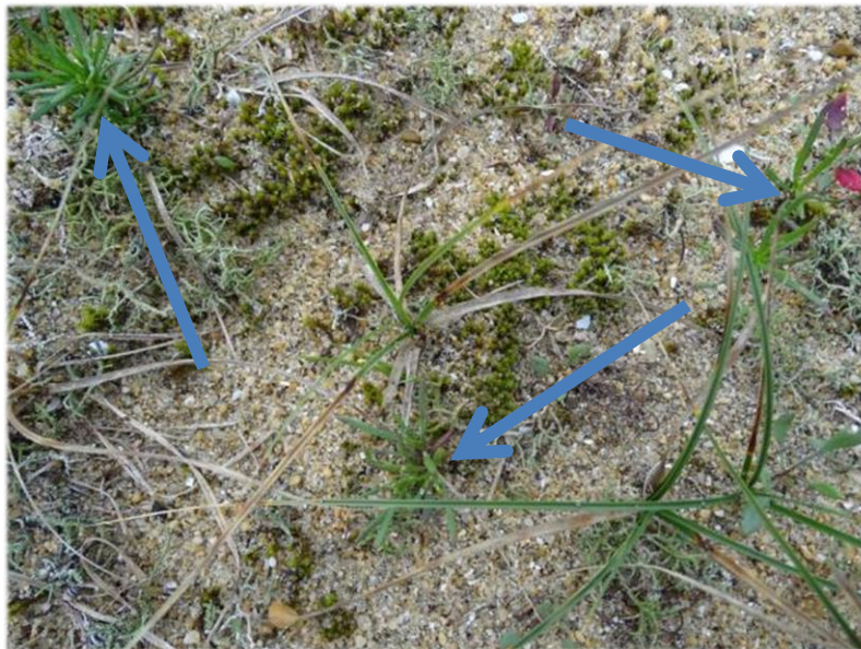
Cette photo en plan rapproché montre trois plantules assez difficiles à distinguer.

La situation est plus préoccupante que ce que nous avons pu imaginer au début de l'opération. En effet, nous escomptions une reprise moins rapide et nombreuse des plants. La capacité germinative est élevée, mais peu durable et nous pensions réduire assez complètement la population en deux ans. Or, il s'avère qu'une quantité non négligeable de plantules a certainement échappé à la vigilance des ramasseurs.