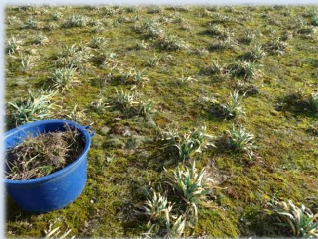
Après arrachage, les pieds de Pancratium maritimum ( Lis matthiote ) sont intacts et débarrassés des embahissants séneçons ! L'impact sur la couverture végétale semble peu important.