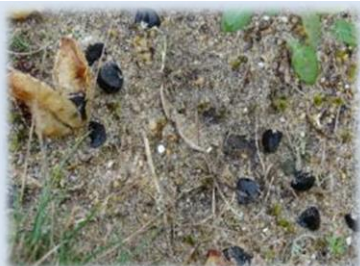
Graines de Lis Matthiole sur sol nu

Par conséquent, nous ne concluons pas sur un impact négatif du chantier sur le milieu, du fait du piétinement ou de la circulation d'engin, dans la mesure où cette action reste ponctuelle et que des précautions sont prises.