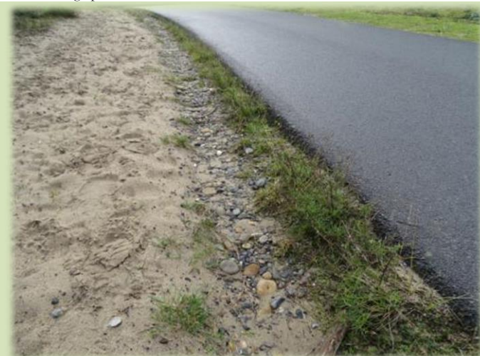
Peuplement continu de sénéçon du Cap le long de la piste cyclable. Les racines profitent de l'abri offert par la chaussée, qui leur apporte de l'humidité.

L'arrachage n'est pas difficile à exécuter à la main, et il est même préférable de ne pas porter de gants afin de saisir au mieux la plante au niveau du collet. On laisse ainsi moins de racines dans le sol. Ce point est important au niveau de la voirie, car les plants ont été fauchés, et leur enracinement plus développé : en tirant seulement sur les tiges, la souche reste en place dans le sol... De plus, des plants se trouvent juste en bordure de l'enrobé, profitant de l'humidité présente sous la chaussée, ce qui rend leur arrachage plus délicat.