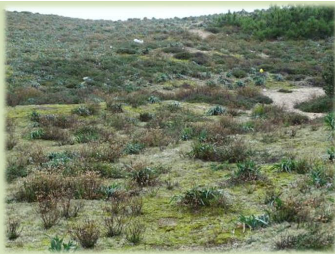
Zone abritée où le Sénéçon peut se développer en touffes compactes au sein du peuplement de Lis des sables.

Comme il est préférable de travailler accroupi, les plants sont placés dans un bac, puis transvasés dans des sacs.