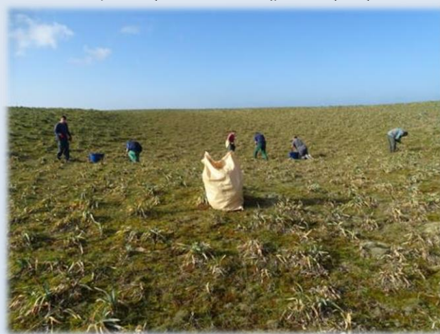
Le travail est assez laborieux, et l'avancement est très lent, on travaille souvent accroupi.