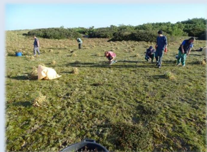
L'opération demande une grande attention afin de limiter les oublis, ce qui n'est pas toujours facile, car le Séneçon n'est pas toujours bien visible à cette période de l'année.