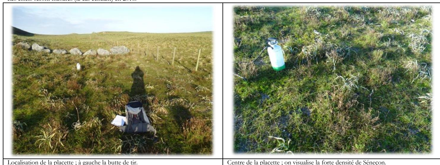
Localisation de la placette ; à gauche la butte de tir.

Les effets seront mesurés (le cas échéant) en 2016.