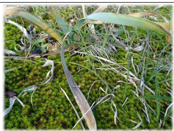
Après une courte observation photographique, il est rentré dans un terrier difficilement visible sous un pied de Lis des sables.