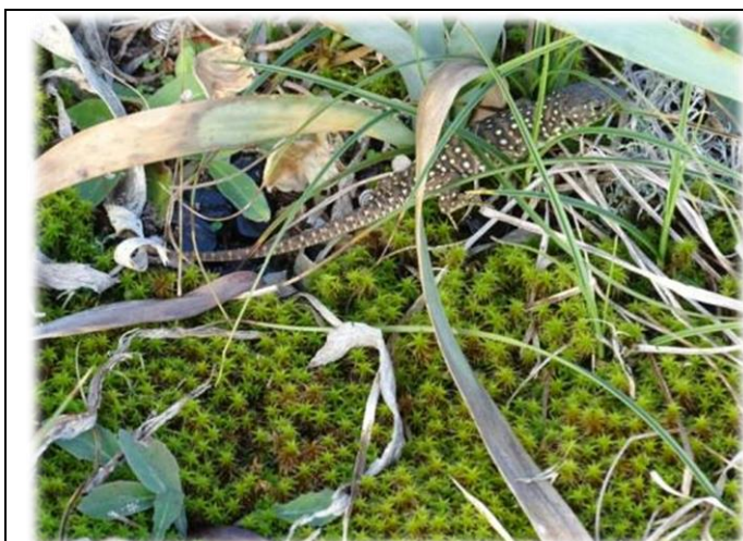
Jeune Lézard ocellé, observé par un ouvrier surpris de voir ce lézard « à pois ».

Nous avons pu observer un jeune lézard ocellé, qui s'est ensuite réfugié dans son terrier sous un pied de Lis.