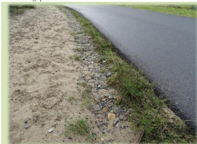
Peuplement continu de sénéçon du Cap le long de la piste cyclable. Les racines profitent de l'abri offert par la chaussée, qui leur apporte de l'humidité.

L'arrachage n'est pas difficile à exécuter à la main, et il est même préférable de ne pas porter de gants afin de saisir au mieux la plante au niveau du collet. On laisse ainsi moins de racines dans le sol. Ce point est important au niveau de la voirie, car les plants ont été fauchés, et leur enracinement plus développé : en tirant seulement sur les tiges, la souche reste en place dans le sol... De plus, des plants se trouvent juste en bordure de l'enrobé, profitant de l'humidité présente sous la chaussée, ce qui rend leur arrachage plus délicat.