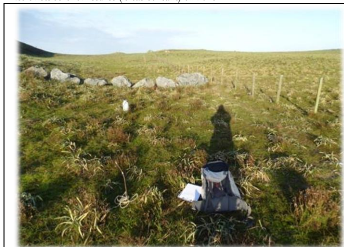
Localisation de la placette ; à gauche la butte de tir.

Les effets seront mesurés (le cas échéant) en 2016.