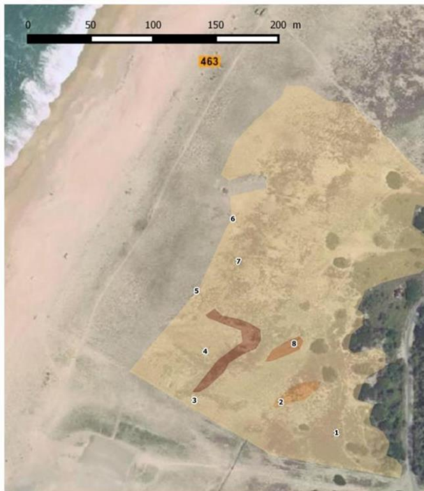
Carte de répartition du Sénéçon du Cap – Tarnos sud. La limite ouest est assez nette sur le terrain ; les tâches plus sombres correspondent à des zones de moindre densité ; présence également à l'est au sein de fourrés de Ciste à feuilles de sauge.

Un relevé de végétation a été produit mais, compte tenu de la saison, peu d'espèces ont été observées. Nous considérons n'avoir pas pu observer 50 % des espèces ayant un indice « + » et « 1 » en période de végétation.