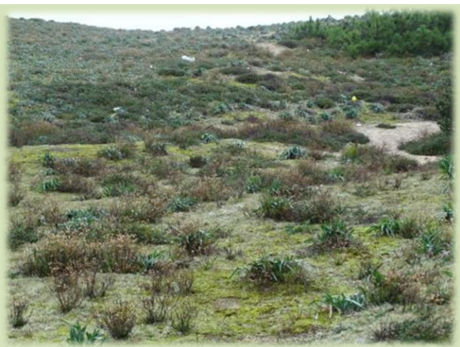
Zone abritée où le Sénéçon peut se développer en touffes compactes au sein du peuplement de Lis des sables.

Comme il est préférable de travailler accroupi, les plants sont placés dans un bac, puis transvasés dans des sacs.