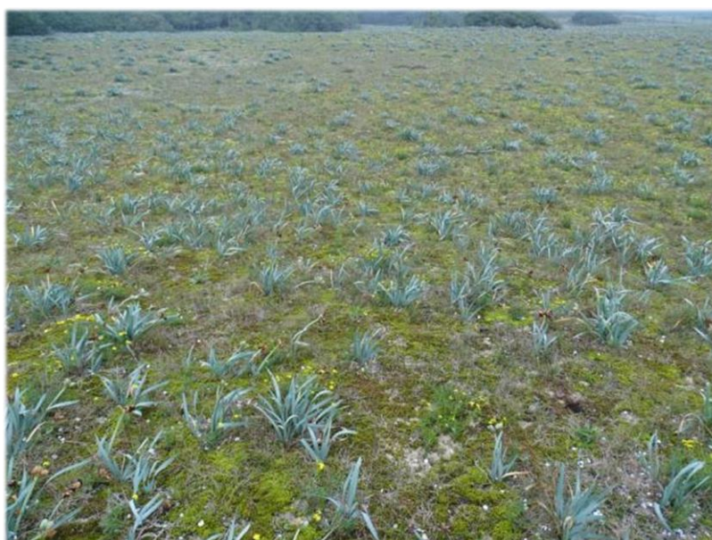
Une vue de la zone traitée en 2015. Même si la densité semble inférieure à celle de l'état initial, on constate un fort développement de plants. Tous ont moins d'un an (pas de résidus ligneux au niveau des tiges). On peut supposer que, outre les plantules oubliées, il y a eu de la germination.