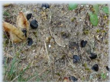
Graines de Lis Matthiole sur sol nu

Par conséquent, nous ne concluons pas sur un impact négatif du chantier sur le milieu, du fait du piétinement ou de la circulation d'engin, dans la mesure où cette action reste ponctuelle et que des précautions sont prises.