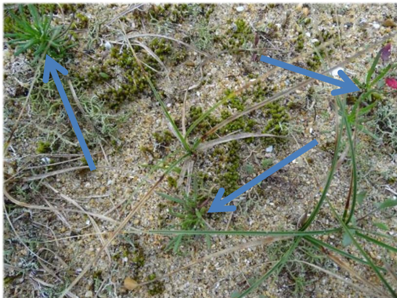
Cette photo en plan rapproché montre trois plantules assez difficiles à distinguer.

La situation est plus préoccupante que ce que nous avons pu imaginer au début de l'opération. En effet, nous escomptions une reprise moins rapide et nombreuse des plants. La capacité germinative est élevée, mais peu durable et nous pensions réduire assez complètement la population en deux ans. Or, il s'avère qu'une quantité non négligeable de plantules a certainement échappé à la vigilance des ramasseurs.