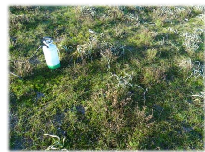
Centre de la placette ; on visualise la forte densité de Sénéçon.