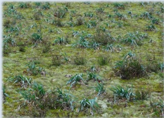
Secteur de densité moyenne à forte.