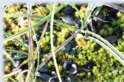
Graines de Lis sur couverture de Tortula