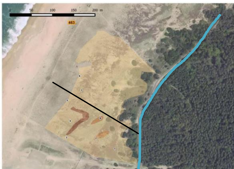
Trait bleu : arrachage en bordure de la piste cyclable ; trait noir : au sud, partie faite en 2015, au nord en 2016.

Au regard de la cartographie faite en 2015, la zone traitée en 2016 était située au nord de celle réalisée en 2015 (matérialisée par le trait noir). Ceci correspond à la totalité de la partie analysée en 2015 pour établir l'état des lieux. La surface faite en 2016 est de l'ordre de 3,3 ha, et une action a également concerné l'arrachage en bordure de la piste cyclable sur environ 500 m (depuis le niveau de la butte de tirs et vers le nord).