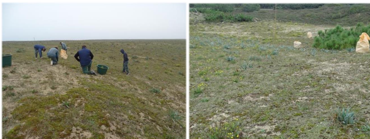
A gauche, lente progression... Des retours en arrière sont indispensables pour éviter d'oublier trop de plantules. A droite, secteur de récolte (près des sacs), et l'on peut bien visualiser les Sénéçons qui sont en fleurs quasiment toute l'année.

Rappelons que cette opération est avérée fastidieuse, car il convient de travailler groupés et de repasser sur les zones traitées afin d'enlever les « oubliés ». Le moniteur organise les virées afin de pouvoir progresser en ligne. Les plants sont mis d'abord dans des bacs, puis versés dans des sacs. Un piquetage permet de guider les virées.