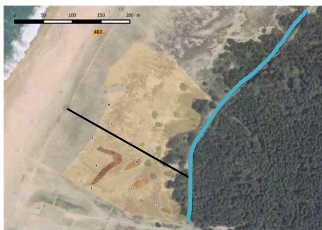
Trait bleu : arrachage en bordure de la piste cyclable ; trait noir : au sud, partie faite en 2015, au nord en 2016.