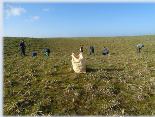
Le travail est assez laborieux, et l'avancement est très lent, on travaille souvent accroupi.