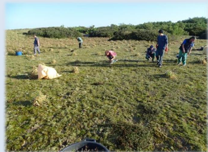
L'opération demande une grande attention afin de limiter les oublis, ce qui n'est pas toujours facile, car le Séneçon n'est pas toujours bien visible à cette période de l'année.