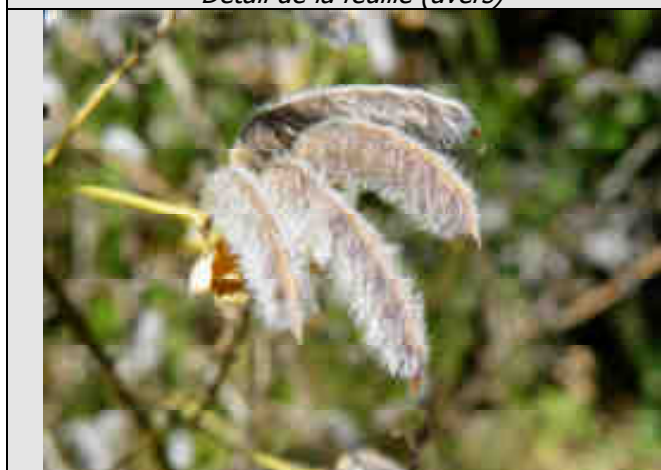
Gousses bien pubescentes caractéristiques