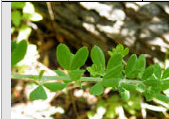
Rameau feuillé sur site