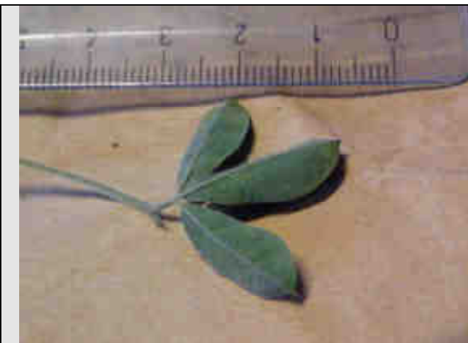
Détail de la feuille (revers)