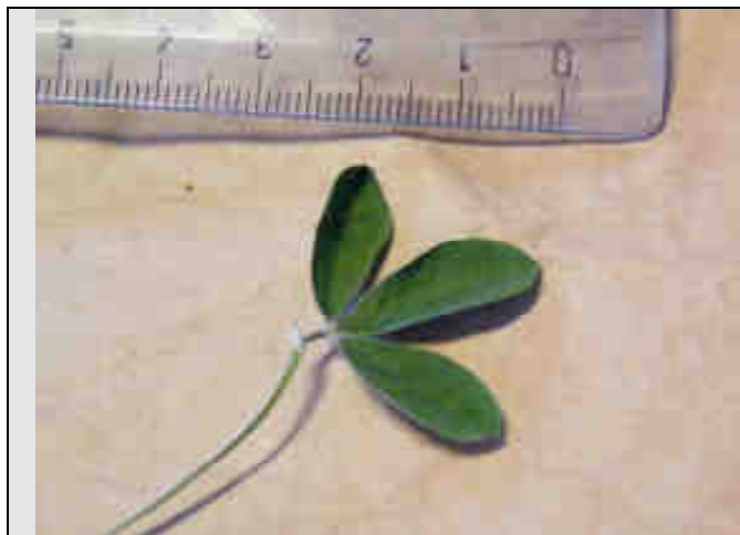
Détail de la feuille (avers)